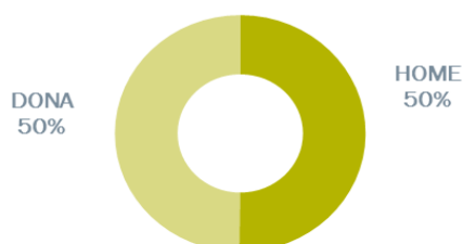
CONTRACTACIÓ REGISTRADA PER SEXE